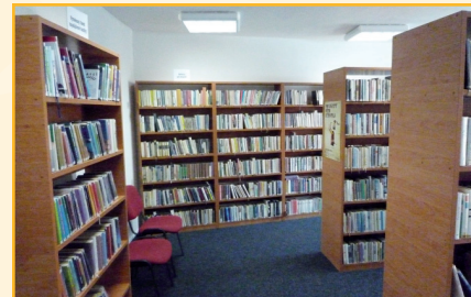
Prostory nové knihovny

Všechna zmiňovaná zařízení jsou již k dispozici. Realizačně jsme nejvíce tlačili na termín otevření prostor základní umělecké školy v přízemí kulturního domu. Zde je provoz už od října loňského roku a máme za sebou už řadu vystoupení a výstav žáků jako hmatatelný výsledek naplnění cíle projektu. Od března je v provozu knihovna a již teď má registrováno dvakrát více čtenářů, než tomu bylo ve starých prostorách. Co se „muzea“ týče, po slavnostním otevření 1. května je v provozu a má za sebou už řadu prohlídek. Zjevně bude nyní nejví-