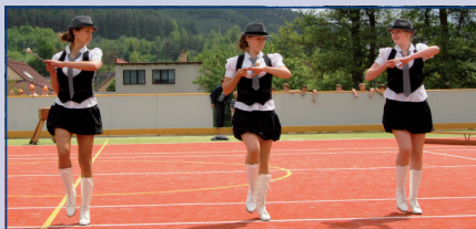
Vystoupení mažoretek v rámci slavnostního otevření hřiště

Nový areál v Dolních Loučkách nahradil nevyhovující sportovní hřiště základní školy, které