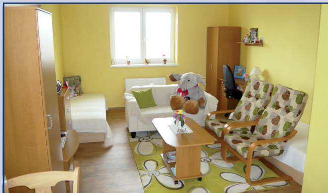
Klienti se v Šanově již zabydleli