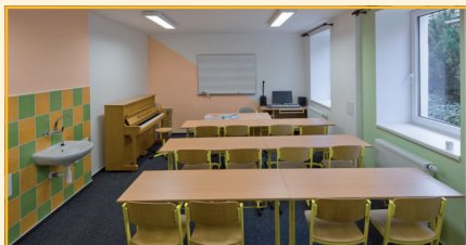
Moderní učebna ZUŠ

Projekt Modernizace a rozšíření kulturních zařízení regionu Olešnicko získal z ROP Jihovýchod dotaci ve výši 7,8 milionů korun při celkové investici 8,4 milionů korun. Proč je v Olešnici potřeba realizovat právě tento projekt jsme se zeptali starosty města, PaedDr. Zdeňka Peši.