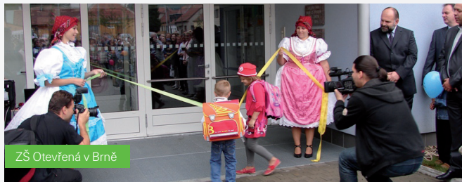
ZŠ Otevřená v Brně

■ v oblasti školství se například podařilo vybudovat kompletně novou Základní školu Otevřená v Brně-Žebětíně, víceúčelovou tělocvičnu při EZŠ a MŠ Čejkovická v Brně a přebudovat starou školku v Brně-Bosonohách na centrum volnočasových aktivit nejen pro děti a mládež.