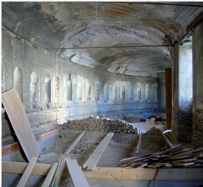
Zchátralá hospodářská budova před počátkem projektu.