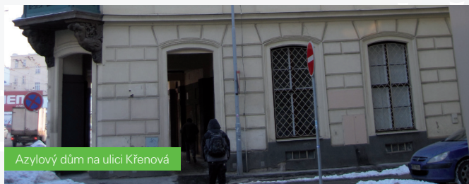
Azylový dům na ulici Křenová

■ mezi nejvýznamnější investice do zdravotnictví patří vznik 22 lůžek mezioborové jednotky intenzivní péče v Nemocnici Břeclav pro kardiologickou, metabolickou a neurologickou JIP a vybudování nového Pavilonu urgentní a intenzivní péče v Jihlavě.