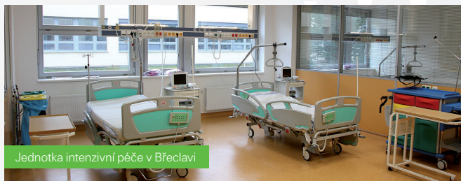
Jednotka intenzivní péče v Břeclavi

■ mezi nejvýznamnější investice do zdravotnictví patří vznik 22 lůžek mezioborové jednotky intenzivní péče v Nemocnici Břeclav pro kardiologickou, metabolickou a neurologickou JIP a vybudování nového Pavilonu urgentní a intenzivní péče v Jihlavě.