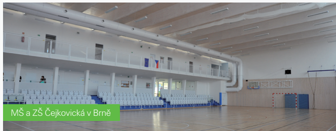
MŠ a ZŠ Čejkovická v Brně