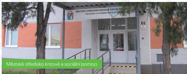
Městské středisko krizové a sociální pomoci

■ v sociální oblasti se například v Brně podařilo rozšířit ubytovací kapacity v azylovém domě na Křenové ulici o 18 lůžek a vzniklo také Městské středisko krizové sociální pomoci pro osoby v extrémní sociální tísní. Na Vysočině bylo v roce 2012 schváleno k financování a postupně vstupuje do realizace hned několik sociálních projektů, například denní stacionáře v Bystřici nad Pernštejnem, centrum denních služeb v Brtnici, chráněné bydlení v Hrotovicích a Havlíčkově Brodě a další.