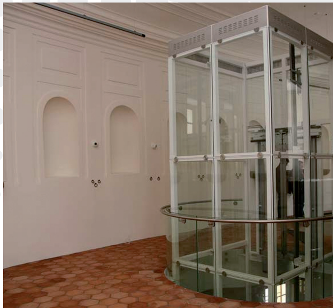
Stejná budova v průběhu realizace ve Slavkově. Vzniká zde expozice o napoleonské době.

Ve Slavkově u Brna se díky dotaci z ROP Jihovýchod v předpokládané výši 48,8 milionu korun podaří zachránit hospodářské budovy umístěné v předzámčí slavkovského zámku. Vznikne zde expozice o napoleonské době.