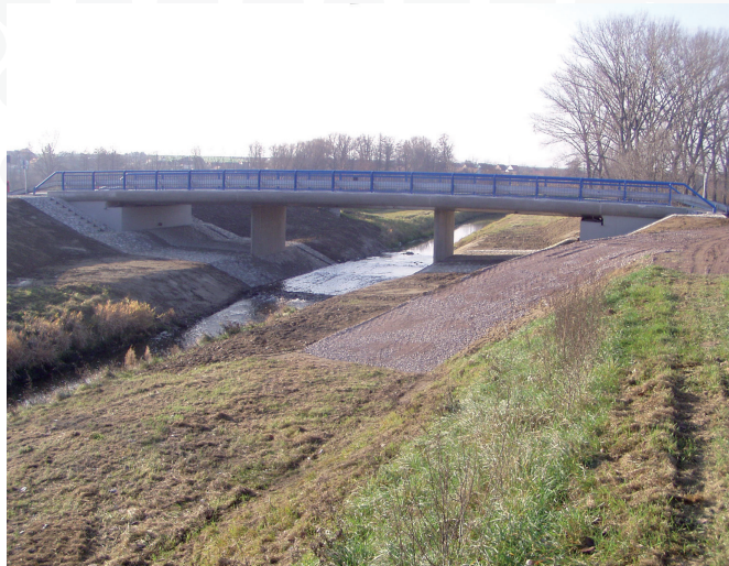
Díky evropské dotaci vznikl nový most o šířce 7,5 metru.

Dne 12. prosince 2012 byl slavnostně otevřen nový most v Prosiměřicích přes řeku Jevišovku a k němu přilehlá nově rekonstruovaná komunikace II/413 v celkové délce 0,769 kilometru.