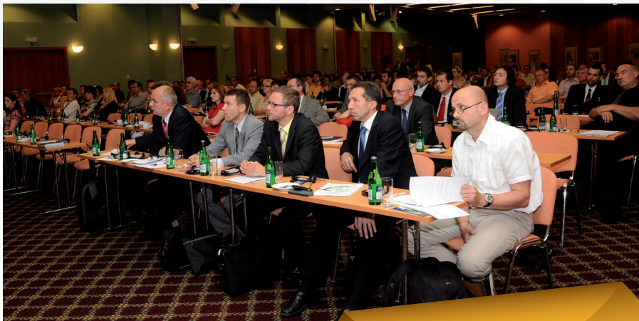
Také letos v červnu pro vás pořádáme výroční konferenci ROP Jihovýchod.

Milí čtenáři newsletteru ROP Jihovýchod, s novou grafikou časopisu Vám přinášíme také částečnou změnu obsahovou. Každé číslo newsletteru bude zaměřeno na jedno město z Kraje Vysočina či Jihomoravského kraje a ukážeme Vám, jaké projekty byly v tomto městě podpořeny, kam se v rozvoji posunulo a co nového v něm evropské dotace přinesly obyvatelům. Poradíme Vám také, co ve městě zajímavého navštívit a kam vyrazit do okolí na výlet. Stále Vám budeme přinášet důležité informace z aktuálního dění v Regionální radě, o právních předpisech, nově otevřených projektech a mnoho dalšího.