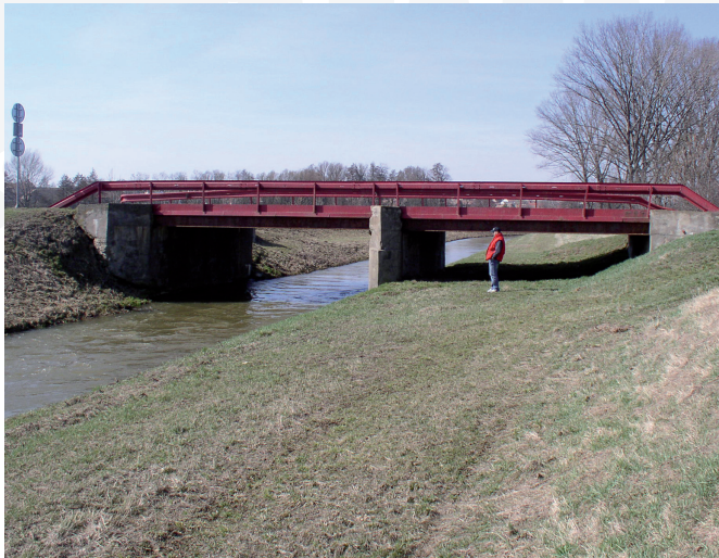
Původní most byl již ve špatném technickém stavu.