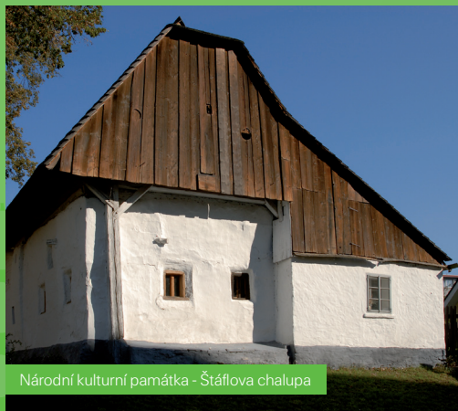
Národní kulturní památka - Štáflova chalupa