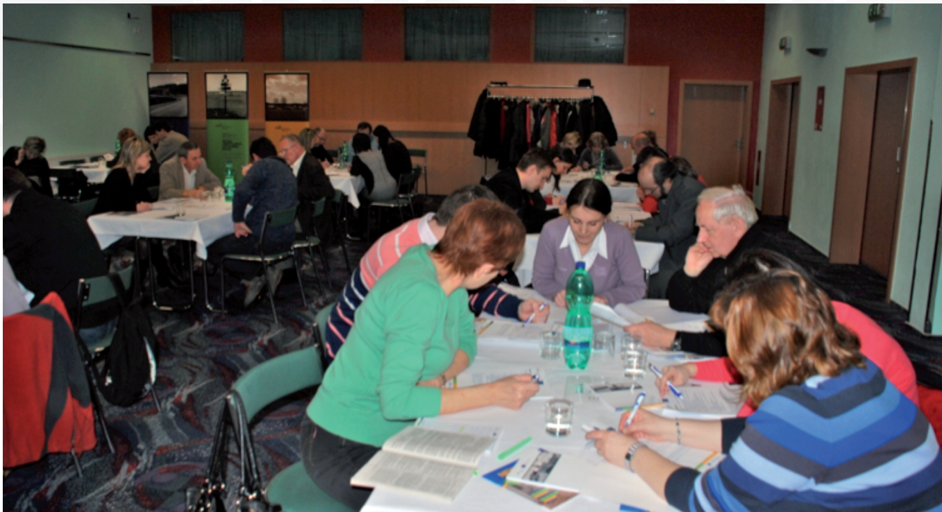
Účastníci semináře 14. února v Brně při řešení případových studií.