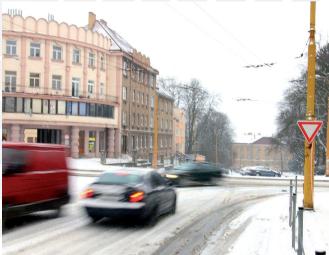
Provoz na křižovatce ulic Fritzova a Legionářů budou řídit semaforey.