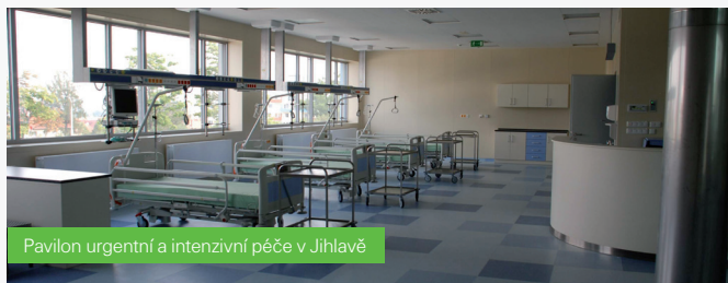
Pavilon urgentní a intenzivní péče v Jihlavě

■ v oblasti školství se například podařilo vybudovat kompletně novou Základní školu Otevřená v Brně-Žebětíně, víceúčelovou tělocvičnu při EZŠ a MŠ Čejkovická v Brně a přebudovat starou školku v Brně-Bosonohách na centrum volnočasových aktivit nejen pro děti a mládež.