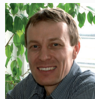
Autor článku: Ing. Marek Bena specialista na veřejné zakázky

Na uvedené webové stránce je k dispozici také sada kontrolních listů aktuálně používaných pro kontroly zadávacích a výběrových řízení. Pro zadavatele tak může být výhodné vyzkoušet si na jednotlivé kontrolní dotazy odpovědět ještě předtím, než zadávací řízení předloží ke kontrole poskytovateli dotace.