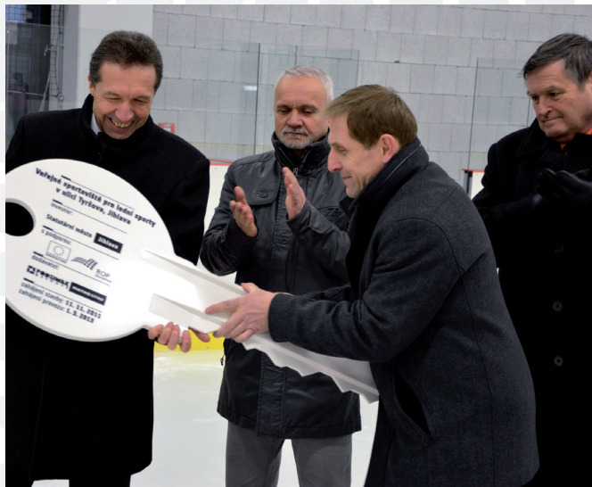
Symbolické předání klíče od sportoviště.