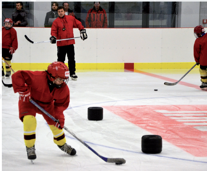
Ukázka tréninku při slavnostním otevření stadionu.

Už od víkendu 2. a 3. března 2013 mohou zájemci nejen z Jihlavy využívat nové Sportoviště pro lední sporty v Tyršově ulici. Hala bude sloužit především pro bruslení veřejnosti, škol a tréninky hokeje a krasobruslení. Na první víkend byly připraveny ukázky tréninků, soutěže a hry na ledě a hlavně bruslení pro veřejnost. Regionální rada Jihovýchod podpořila vybudování veřejného sportoviště dotací ve výši 176,3 milionu korun.