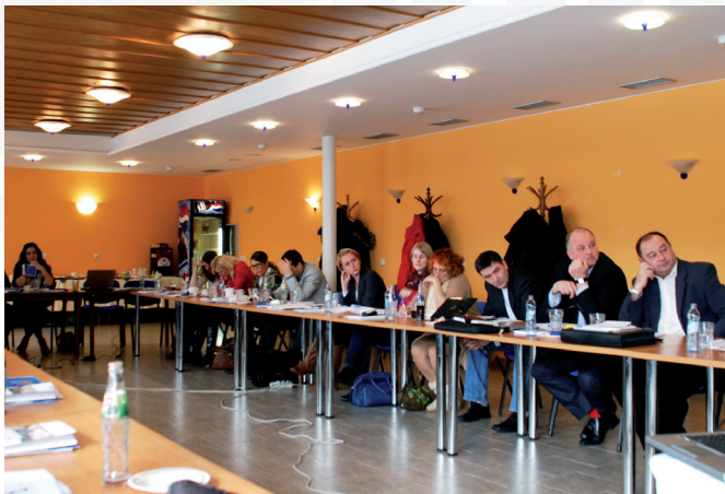
Účastníci setkání u kulatého stolu k cestovnímu ruchu.