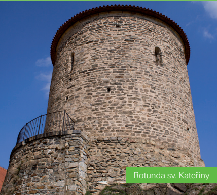
Rotunda sv. Kateřiny