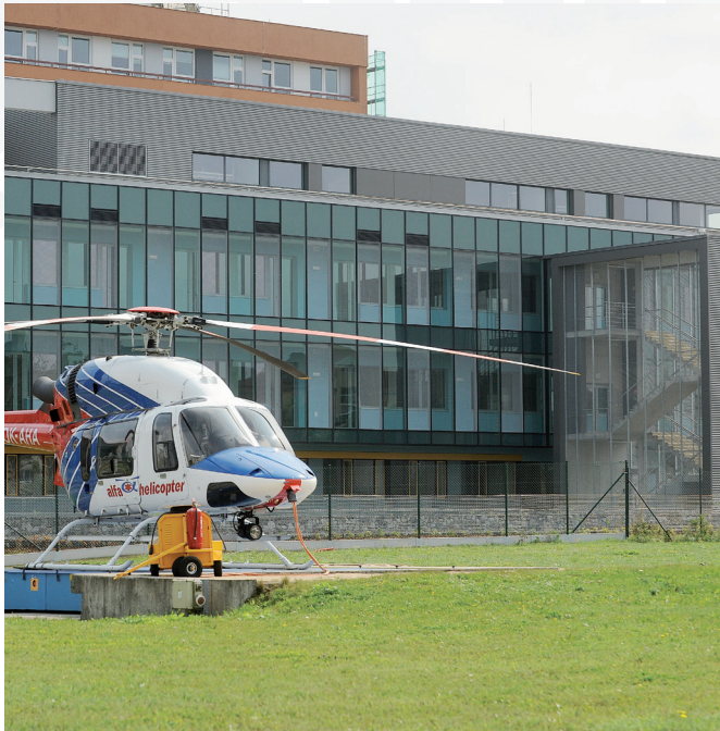
Projekt Pavilon urgentní a intenzivní péče v Jihlavě

Projekty podpořené Regionálním operačním programem Jihovýchod bodují v odborné soutěži. Projekt Pavilon urgentní péče v Jihlavě získal prestižní ocenění Nejlepší investice soutěže TOP INVEST 2012. Dalším oceněným projektem se stal Ráj permoníků v Oslavanech, který získal Čestné uznání soutěže TOP INVEST 2012.