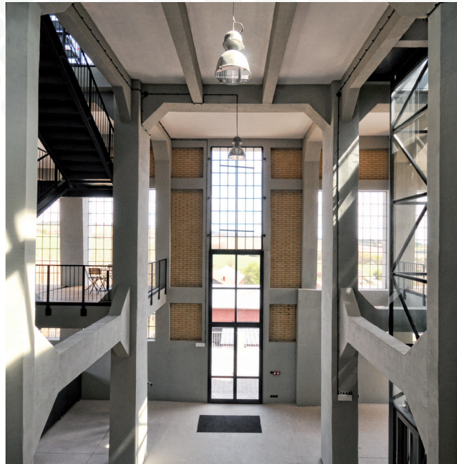
Ráj permoníků – zpřístupnění kulturní památky těžní věže Dolu KUKLA v Oslavanech

Soutěž TOP INVEST vyhlašuje každoročně Svaz podnikatelů ve stavebnictví v ČR. Soutěží se o nejlepší investiční záměr uplynulého roku. Zúčastnit se ho mohly všechny stavby, jejichž přínosem je buď dobrá ekonomická návratnost investice, nebo společenský význam a obohacení kulturního, sportovního či společenského postavení města či regionu. Vypisovatelé soutěže jsou Ministerstvo průmyslu a obchodu ČR, Ministerstvo pro místní rozvoj ČR, Svaz podnikatelů ve stavebnictví v ČR a Veletrhy Brno, a. s.