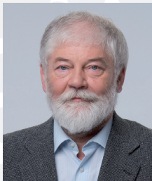
MVDr. Pavel Heřman starosta města Třebíče