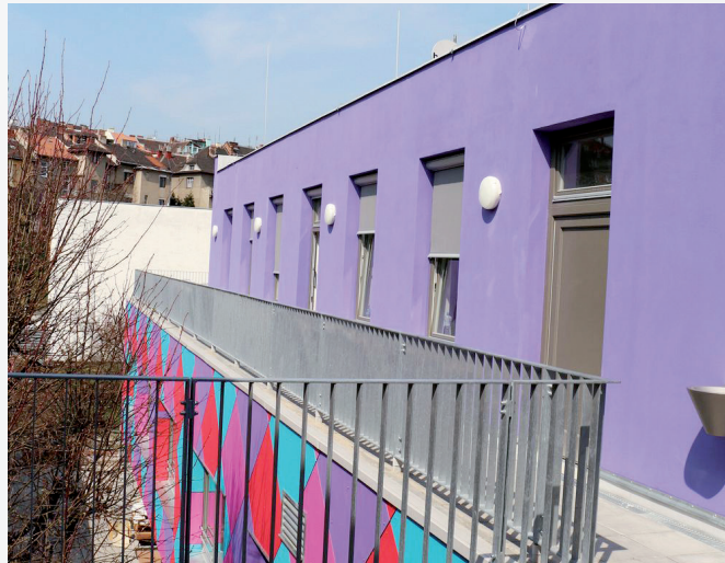
Rekonstrukce budovy Centra integračních služeb probíhala od listopadu 2011 do ledna 2013.

18. dubna 2013 bylo slavnostně otevřeno Centrum integračních služeb v Brně na Vranovské ulici. Budova byla zrekonstruována díky podpoře z Regionálního operačního programu Jihovýchod v předpokládané výši 24 milionů korun.