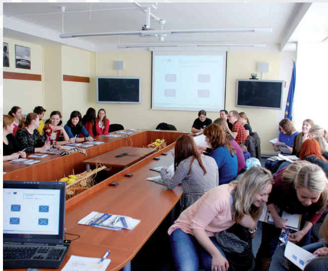
Studenti pracovali v dobré náladě.

Studenti Ekonomicko-správní fakulty Masarykovy univerzity oboru Regionální rozvoj a správa mají dostatečné znalosti o ROP Jihovýchod. Pomohla tomu i jejich osobní účast na OPEN DAYS, které jsme pro ně připravili ve dnech 19. a 26. března 2013 u nás, v sídle Regionální rady v Brně na Kounicově ulici.