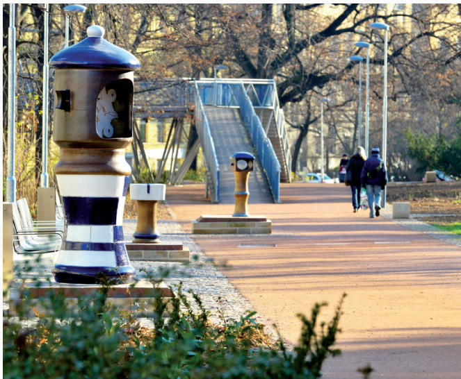
Park na Kolišti nyní láká k relaxaci, oddychu i trávení volného času uprostřed centra města.