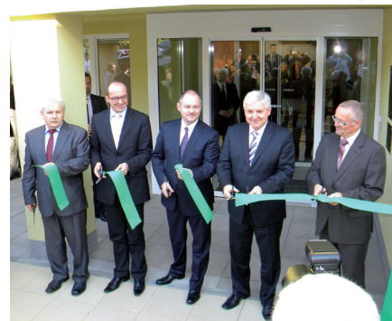
Slavnostní otevření centra proběhlo za účasti významných hostů.

Zajištění nového provozu přinese nově vytvořená pracovní místa pro celkem 28 pracovníků.