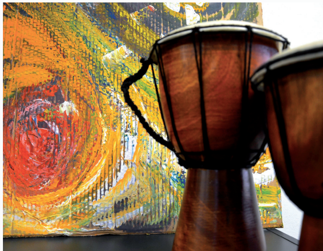
Kontaktní místnost pro nerušený rozhovor pracovníka s klientem, hudební zkušebna – dvě z nových místností v Zastávce.

Ve středu 30. října 2013 proběhlo Slavnostní otevření Zastávky. Za účasti zástupců města Telče, Kraje Vysočina, vedení Diecézní charity Brno, Oblastní charity Jihlava a ROP Jihovýchod byl zahájen provoz nové budovy. Diecézní charita získala na výstavbu nové budovy dotaci z ROP Jihovýchod v předpokládané výši 8 milionů korun.