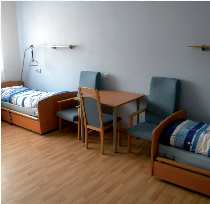
Zbrusu nové pokoje jsou připraveny pro další klienty. Kapacita centra se zvýšila o 60 míst.

Dne 8. října 2013 se uskutečnilo slavnostní odevzdání a převzetí dokončené stavby „Centrum služeb pro seniory Kyjov – rozšíření“, 25. října pak Den otevřených dveří pro veřejnost. Projektu byla proplacena první část dotace z ROP Jihovýchod ve výši 28,3 milionu korun.