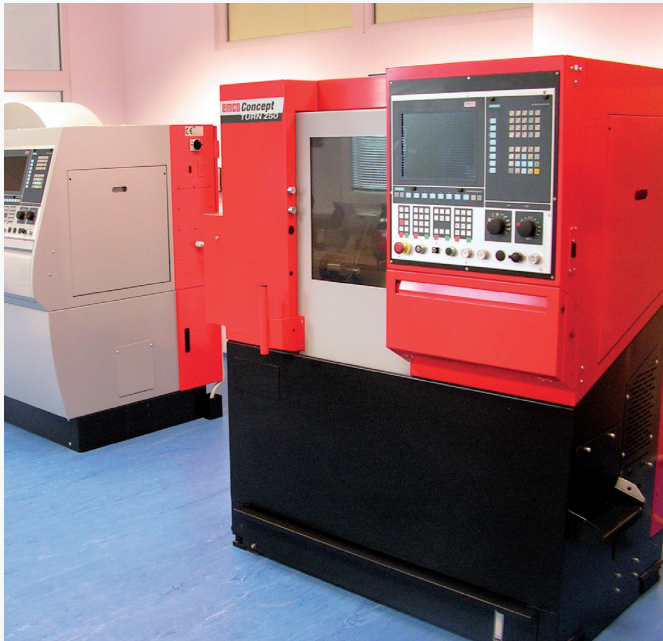
Výukové CNC stroje, které byly pořízeny díky dotaci z ROP Jihovýchod.