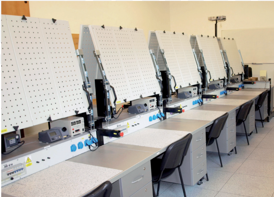
V dílně elektrikáře mohou žáci pracovat na 12 individuálních pracovištích.