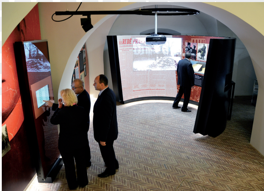
Expozice Lidé. Místa. Osudy.