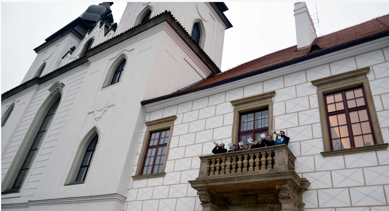
Slavnostní otevření zámku Třebíč proběhlo 21. listopadu 2013 po tříleté rekonstrukci. Během prvního otevřeného víkendu navštívilo zámek neuvěřitelných 5 500 návštěvníků.

Po tříletém uzavření z důvodu generální rekonstrukce objektů i expozic se otevřel zámek v Třebíči. Čtyři nové prohlídkové trasy Muzea Vysočiny, které zde sídlí, přibližují přírodní bohatství Třebíčska, klášterní historii areálu, upozorňují na poslední majitele zámku Valdštejny i na trebičské betlémy. Celková obnova a regenerace zámecké budovy národní kulturní památky proběhla díky dotaci z ROP Jihovýchod.