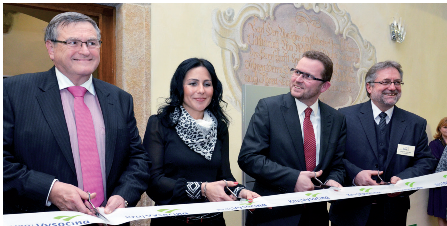
Slavnostní stříhání pásky na zámku v Třebíči.