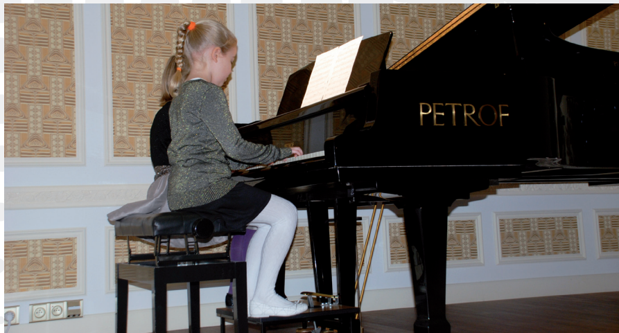
Po rekonstrukci se počet žáků ZUŠ Jihlava zvýšil na současných 1 240 žáků.

Při archeologickém průzkumu se podařilo určit stáří trámů ve stěnách, které ve stabilním