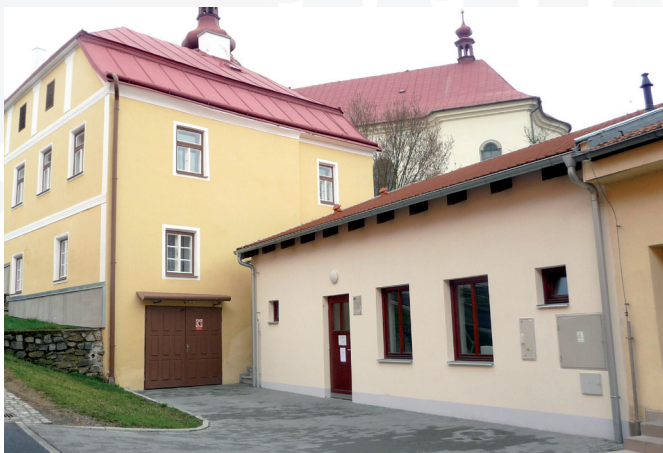
Centrum denních služeb má pro své klienty otevřeno od 7.00 do 15.30 hodin. Cílem služby je rozvíjet soběstačnost klientů.

Od listopadu 2013 je v provozu Centrum denních služeb v Brtnici. Tato služba je určena především pro seniory, kteří mají k dispozici moderní a bezbariérové prostředí. Centrum klientům nabízí zázemí pro osobní hygienu – koupelnu s bezbariérovou vanou a sprchovým koutem a dále prostor pro pedikúru a péči o nohy. Součástí centra je i společenská místnost, která je využívána pro programy zaměřené na sociálně-terapeutické a aktivizační činnosti. Seniorům nabízíme k zapůjčení speciální a kompenzační pomůcky.