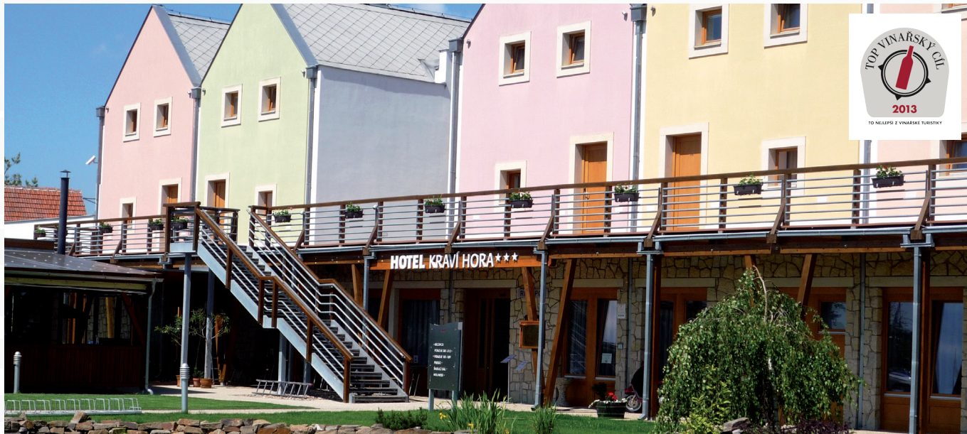
Hotel Kraví hora nabízí ubytování u obce Bořetice, která se nachází v samém srdci Velkopavlovické vinařské oblasti v mikroregionu Modré Hory a sousedí s 280 vinnými sklepy.

O vítězi soutěže TOP vinařský cíl, kterou pořádá Vinařský institut, rozhoduje svými hlasy široká veřejnost – návštěvníci a turisté. Na šestém místě z deseti vyhlášených nejoblíbenějších cílů putování za vínem z celé České republiky se umístil Hotel Kraví Hora.