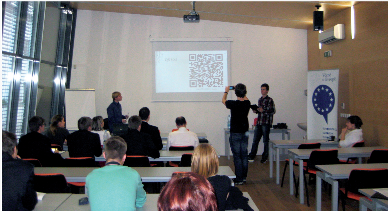
Studenti prezentovali svůj projekt před porotou složenou z expertů z ROP Jihovýchod a Ministerstva pro místní rozvoj.

V prosinci minulého roku se v budově Krajského úřadu Jihomoravského kraje konalo vyhodnocení regionálního kola studentské soutěže Navrhni projekt. Z 16 studentských týmů a jejich předložených projektových návrhů byly po těžkém rozhodování vybrány čtyři týmy. Týmy dostaly příležitost prezentovat své projekty před odbornou porotou složenou z expertů z ROP Jihovýchod a Ministerstva pro místní rozvoj, která několikrát ocenila kvalitu zpracovaných návrhů.