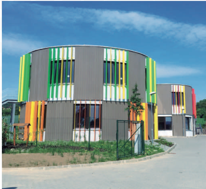
Kompletně nová mateřská škola v Drásově

Projekt přístavby MŠ a ZŠ Ráječko je u konce, i díky příslibené dotaci z ROP Jihovýchod ve výši téměř 11,5 milionu korun. Nová třída mateřské školy nabídne dalších 25 míst pro děti z Ráječka a okolí, nová třída základní školy, která nahradí starou a nevyhovující, zajistí žákům moderní a dostatečně velké prostory odpovídající aktuálním potřebám výuky.