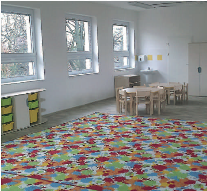
Nová třída MŠ Ráječko je připravená přivítat děti