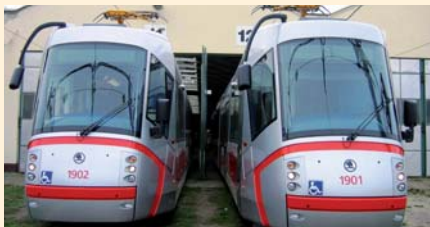
Nové nízkopodlažní tramvaje

„Zatím ne. Julinka, Natálka, Olinka, Maruška a ostatní. To nejsou nové přírůstky brněnských rodičů, ale jsou to nové pětičládkové tramvaje, které v Brně jezdí od poloviny srpna 2009 a finančně se na nich podílely fondy Evropské unie částkou 498 milionů korun. Celkem jich bude třináct. Brno totiž patří mezi evropská města a z tohoto titulu si nemůže dovolit zanedbávat svůj vozový park. Ať žijí naše nové pětičládkové holky.“