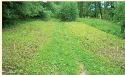
Místo budoucí cyklostezky v Malhostovicích

„NE. Kromě slavnostních příležitostí přestřihování pásky nových projektů, jako tomu bylo například v polovině července u zrekonstruované silnice v Oslavanech, nebo v předposledním srpnovém týdnu v Čejkovicích na Hodonínsku, nám téměř za humny staví obec Malhostovice trasu pro turisty i cyklisty nazvanou Čebínkou na kole ze Zlobice pod Paní horu. Je to zajímavá naučná stezka lokalitou NATURA 2000.“