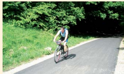
Cyklostezka z Obřan do Bílovic nad Svitavou

„NE. Přijala jsem milé pozvání na otevření Penzionu Kaplanka ve Znojmě. Dotace z ROP Jihovýchod pomohly vybudovat ze středověkého domu v historickém jádru města útulný rodinný penzion. Kromě toho nadšeně vyznám bruslení a volné chvíle využívám na cyklostezkách. Už jsem vyzkoušela i cyklostezku z Obřan do Bílovic nad Svitavou – ještě před jejím dokončením.“