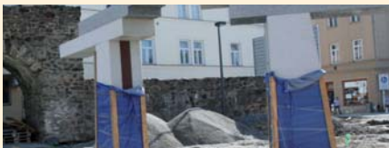
Park Gustava Mahlera

„Ne. Během prázdnin jsem několikrát sedl na kolo a jel se podívat na stavbu všech projektů, které město realizuje s pomocí ROP Jihovýchod. Musím říct, že je to velmi příjemný pocit sledovat rodící se dílo, na jehož dokončení se lidé těší. Vedle ryze městských projektů bedlivě sleduji výstavbu cyklostezky Jihlava–Třebíč–Raabs, jejímž investorem je dobrovolný svazek obcí stejnojmenné stezky. O víkendu bych rád prověřil na této stezce kvalitu čerstvě položeného povrchu na in-line bruslích.“