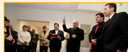
Centru Mahenka požehnal i brněnský biskup Mons. Vojtěch Cikrle

Samotný život se v Mahence teprve rozjíždí. Po nastavení provozních a personálních záležitostí jsou již jasně strukturovány aktivity centra do dvou hlavních oblastí. Tou první je projekt Malá řemesla, jehož hlavní náplní je sociální rehabilitace. Tento program nabízí sociální služby lidem se sociálním i zdravotním znevýhodněním. Zahnuje poradenství, motivaci a především aktivizační a terapeutické činnosti. Denní kapacita objektu je schopna pojmout 15 až 20 klientů. Druhá oblast se zabývá vzděláváním a zvyšováním kvalifikace. V rámci spolupráce s Úřadem práce v Jihlavě zabezpeču-