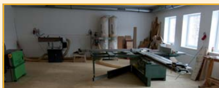
Dílny určené pro rekvalifikační kurzy

Náplní samotného projektu byla stavební rekonstrukce značně zchátralého objektu, ze kterého vzniklo moderně vybavené centrum sociálních služeb Mahenka. Objekt v současné době představuje prostor pro vzdělávání, zvyšování kvalifikace, rehabilitaci, poradenství, terapie a motivaci. V objektu jsou vybudovány praktické a tréninkové učebny, dílny zaměřené na řemesla, poradna, učebna pro výuku počítačové gramotnosti, sociální zařízení, šatny a zázemí pro personál.