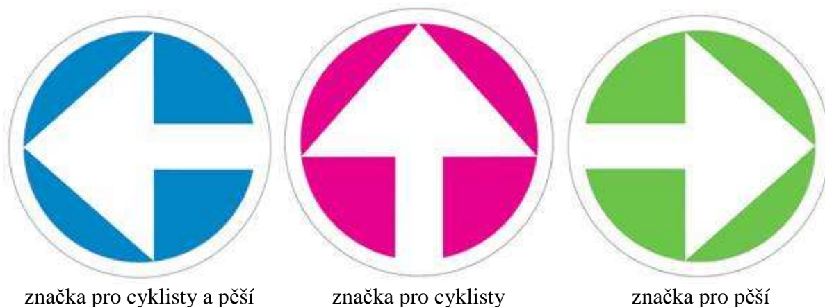
Obr. 2 Požadovaný vzhled doplňkových značek (tabulek).