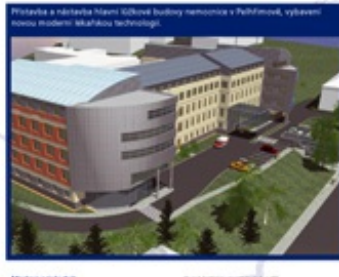
Přístavba a náhrada třetího křídla budovy nemocnice v Písku, vybavení novou moderní lékařskou technologií.

Přesně stanovit, co a jakým způsobem budou uchazeči prokazovat a přiměřenou minimální výši ekonomických a finančních nebo technických předpokladů.