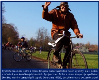
Cyklistezka mezi Dolní a Horní Krupou bude využívána nejen cyklisty, ale i pěšími a účastníky na kolečkových bruslích. Spojení mezi Dolní a Horní Krupou je využíváno školky, kterým usnadní přístup do školy a na hřiště, dospělým trasou do zaměstnání.

Zadávatel zakázky v širším kontextu potřeb organizace