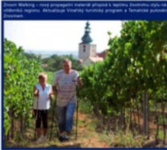
Divný Walking – nový propagační materiál připraven k letnímu dovolené stylu město v regionu. Aktivizace Vlnářky turistický program a Turistické pověsti v Telči.

Jak se vyvarovat? Uchazeč musí dokumentovat k požadovanému kritériu, jak organizace definuje podmínky pro vztahování kritérií.