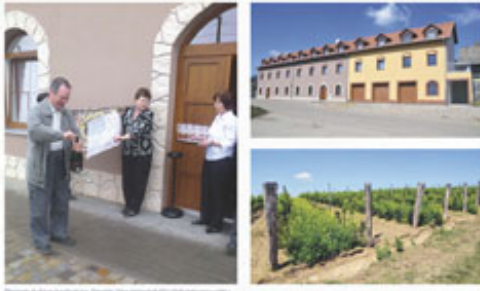
Projekt je financován z rozpočtu Města Hustopeče a z prostředků dotačního programu „Podpora rozvoje venkova“.

V srpnu 18. srpna 2012 byl slavnostně otevřen nový hotel v Hustopečích, který byl postaven v rámci projektu „Uplatnění nové techniky, výtvarné a přírodní architektury (projektovaná architektura)“.