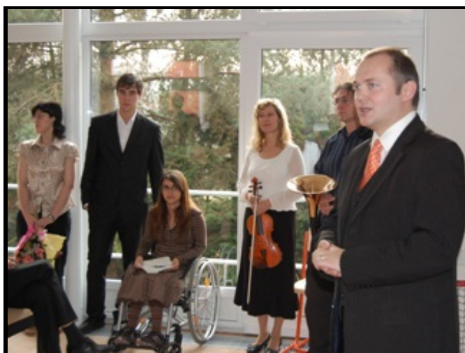
Michal Hašek, hejtman Jihomoravského kraje a předseda Regionální rady Jihovýchod při slavnostním otevření víceúčelového sálu ve Střední škole pro tělesně postižené Gemini v Brně-Lesné